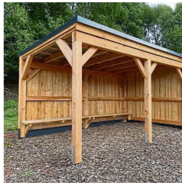
Aufenthaltshütte: Info-Tafeln folgen.