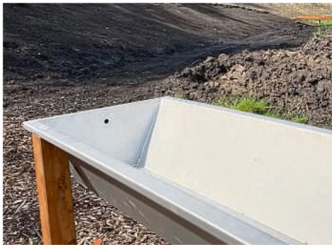
Waschrinne: Im Hintergrund liegt das Tonfeld.