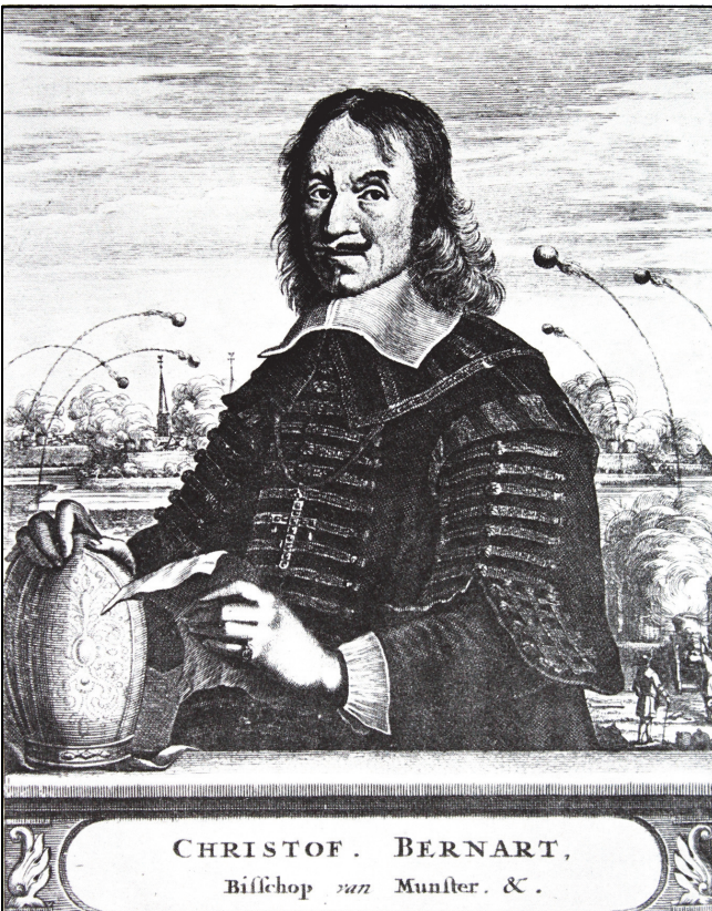
Christoph Bernhard von Galen, Bischof von Münster von 1650 bis 1678 (Ansichtspostkarte des Landesmuseums für Kunst und Kultur, Münster). Er verstrickte das Land in mehrere Kriegszüge und erlangte als „Kanonnenbischof“ und „Bombenbernd“ fragwürdigen Ruhm.

Die Sicht der Anzeigenden war eine eigene: Mit der Anzeige von Straftaten verbanden diese sicherlich ein Vertrauen in die Neutralität ortsfremder Gerichtspersonen, in Vermittlung und Schlichtung durch das Gericht sowie in die zu erwartende Genugtuung über die Strafe für den Rechtsverletzer oder die Rechtsverletzerin. In der kleinen lokalen Welt sollte überdies Gerechtigkeit wiederhergestellt werden. Natürlich gab es niedrigere Beweggründe, die zu Denunziationen führten.