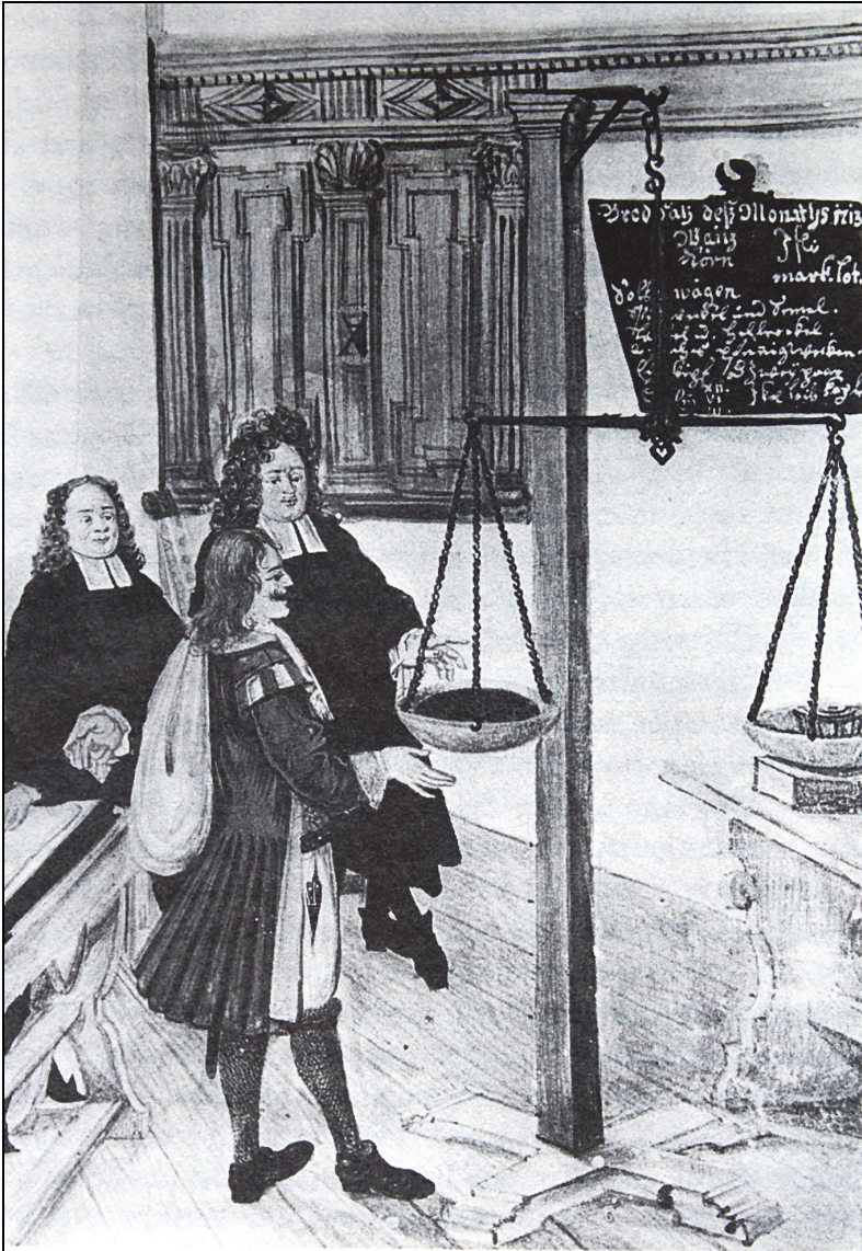
Eine Brotgewichtskontrolle im Jahre 1713. (Aus: van Dülmen, Richard, Kultur und Alltag in der Frühen Neuzeit, 2. Bd.: Dorf und Stadt, München 1992, S. 230; Original: Museum der Stadt Regensburg)