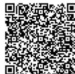
Ratgeber des BBK