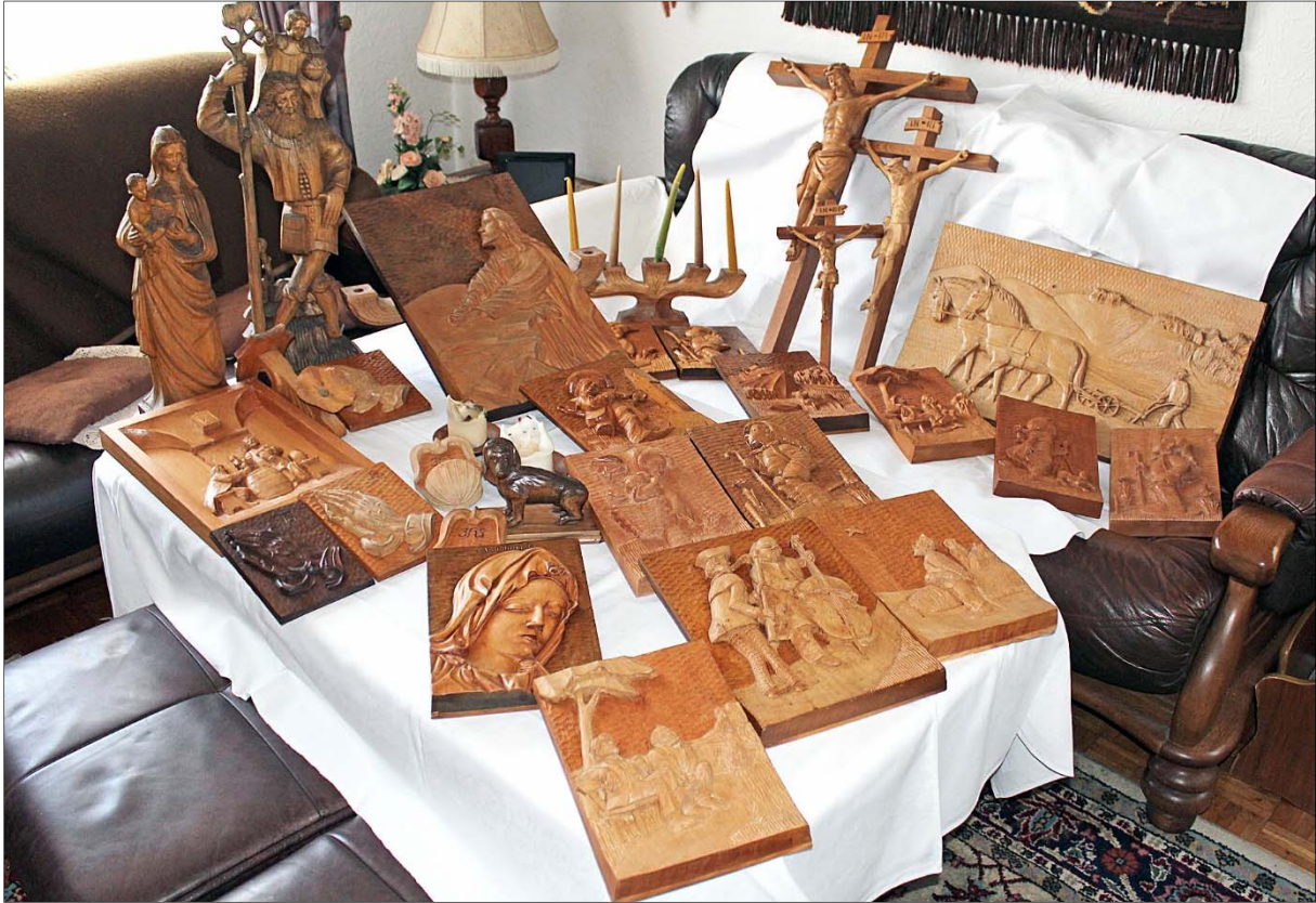
Eine vielfältige Palette an Motiven umfasste das künstlerische Schaffen.