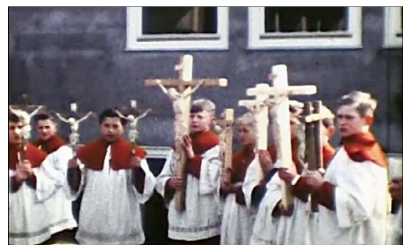
Ministranten überbringen Kreuze für die neue Katholische Volksschule (um 1960).

Ab Ende der 1950er Jahre erhielten alle Klassenräume der neuen Katholischen Volksschule an der Hohen Straße Kreuze mit Korpora aus der Hand von Franz Wessels.