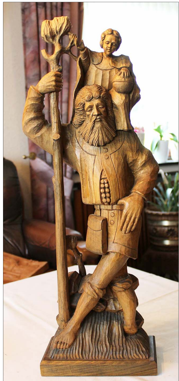
Zwei Holzskulpturen aus der Hand von Franz Wessels: eine Madonna mit Jesuskind und Weltkugel (li.) sowie der heilige Christopherus mit Jesuskind (re.).