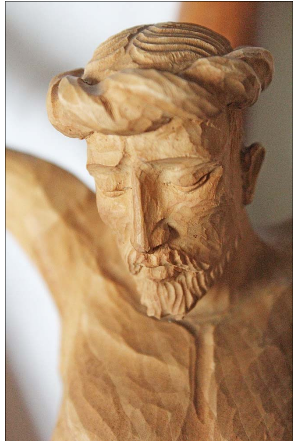
Einige Beispiele für Kruzifixe, die Franz Wessels gefertigt hat. Oben rechts ein Kruzifix im Twistringer Schulzentrum.