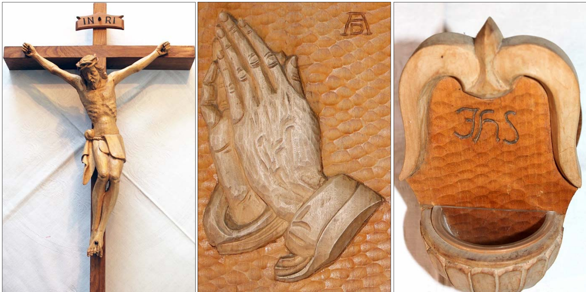
Drei Arten unterschiedlicher Holzkunstwerke für angehende Hochzeitspaare.