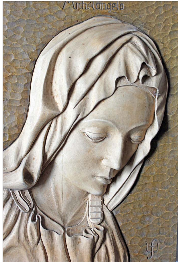
Frauenkopf nach einem Motiv von Michelangelo

Natürlich musste ein Teil der Holzobjekte durch Lasur oder Beize geschützt werden. Während Beize und Lasuren in der Regel durchscheinend sind, sind Lacke meist deckend. Damit geben Sie einem Holzobjekt ein neues Aussehen und überdecken die Struktur.