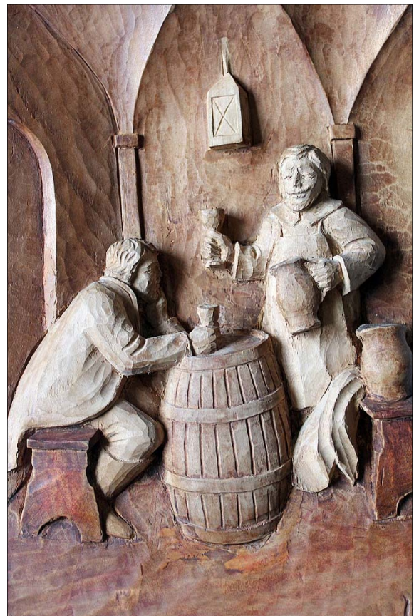
Vier Beispiele für „weltliche“ Motive: Hausfrau am Tisch (oben li.), ein Musikanten-Duo (oben re.), der Geldwechsler (unten li.) und ein Umtrunk am Weinfass (unten re.).