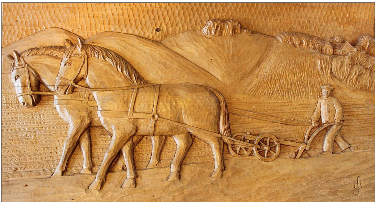
Pflügender Bauer mit zwei Pferden