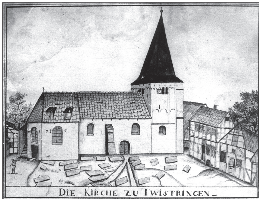
Die romanische St.-Anna-Kirche nach einer Erweiterung von 1785; Zeichnung von 1802

Im selben Jahr konnte also die neue Kirche an der Bahnhofstraße eingeweiht werden. Das Pfarrgrundstück soll zuvor durch einen „Strohmann“ (wahrscheinlich Kaufmann Strahmann, Scharrendorf) erworben worden sein. Das Gotteshaus in Backstein-Neogotik misst 24,5 m in der Länge, in den Kreuzflügeln 11,58 m und hält 260 Sitzplätze vor. Turmhöhe: 34,75 m.