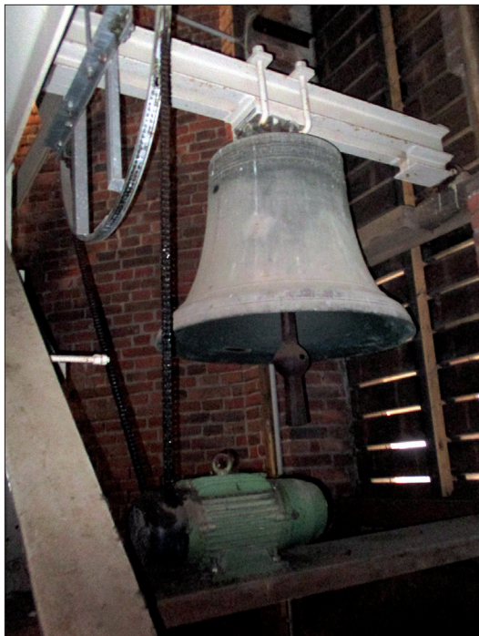
Cort-Meiger-Glocke im Jahr 2016; Quelle: Stadtarchiv Twistringen Themensamm- lungen 2016, Glocken

Der erste evangelisch-lutherische Geistliche in Twistringen war Cort Meiger (s.o.). Eine Glocke von 1525 mit seinem Namen und der Bezeichnung „vicarius“ befindet sich noch heute im Kirchturm der katholischen St.-Anna-Kirche. Ob er von da an bereits lutherisch war, ist unbekannt. Bis vor einigen Jahren wurde diese kleinste Glocke im Turm viertelstündlich von einer Hammermechanik angeschlagen. Jetzt nimmt sie