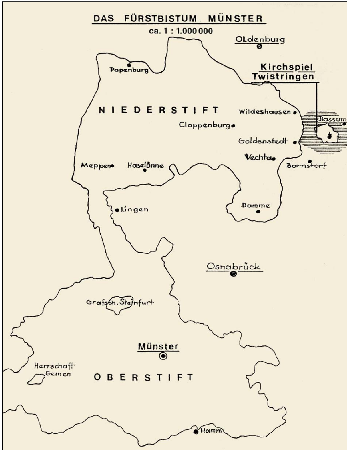
Das Fürstbistum Münster mit der Exklave Twistringen

Bischof von Minden (seit 1530), Osnabrück und Münster (seit 1532). Er war bis zu seinem Tode im Jahre 1553 als Fürstbischof von Münster auch der Landesherr über das Kirchspiel Twistringen, das eine Exklave im Hoyaischen bildete.