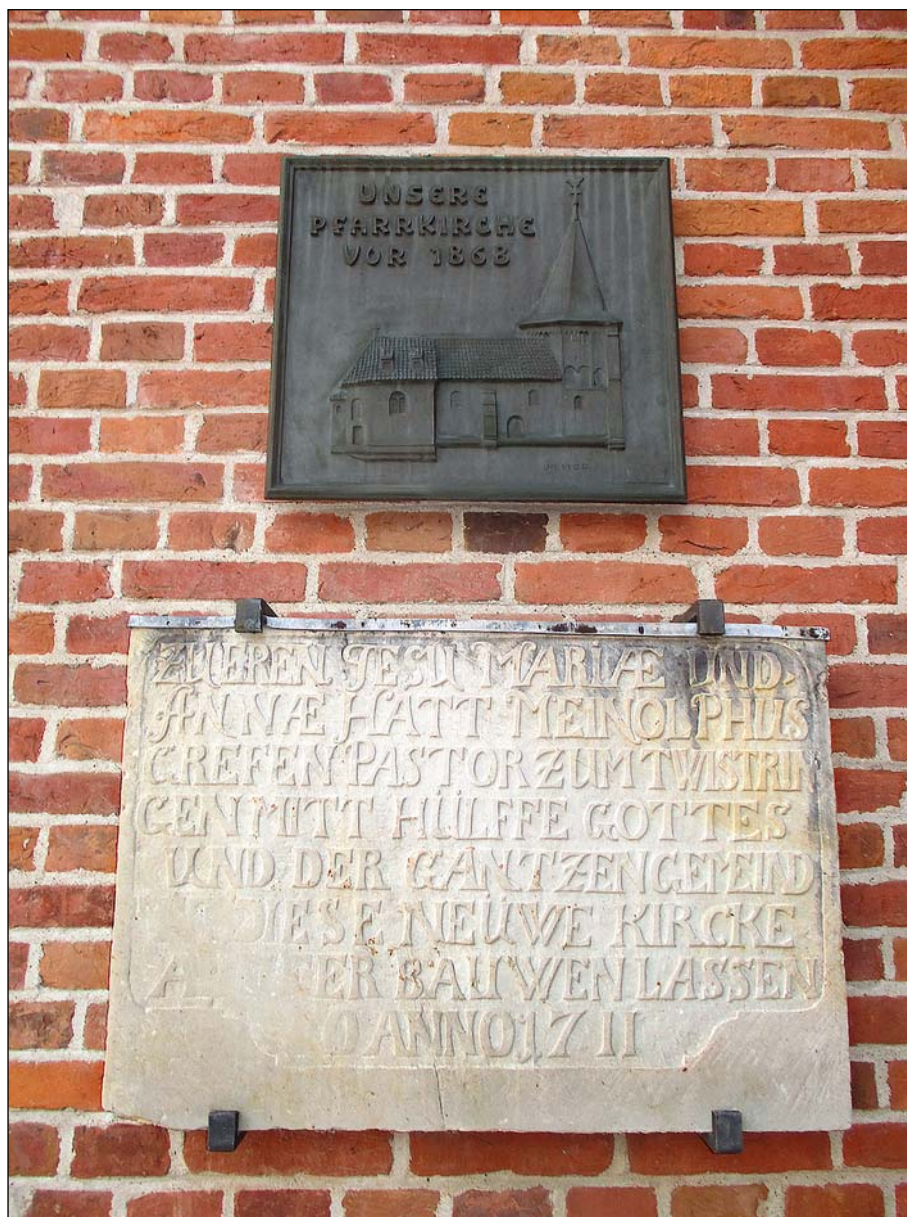
Grundstein der 1711 neu errichteten katholischen Pfarrkirche mit Bronzetafel darüber, die das Gotteshaus zeigt, wie es von 1785 bis vor 1868 aussah.

Bilholts Bericht nahm der Generalvikar zum Anlass, die Entlassung des Vogts zu fordern.