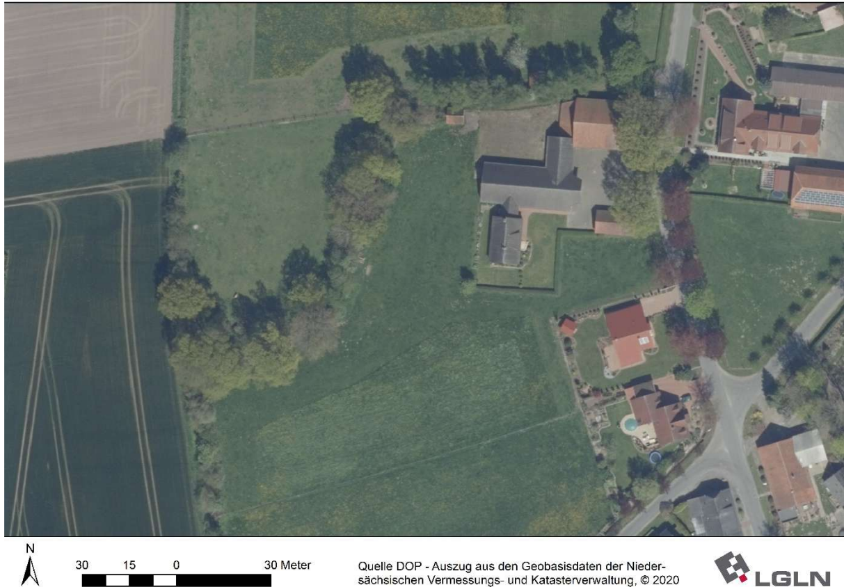
Abbildung 2: Luftbild des Änderungsbereiches

Änderungen des Umweltzustands und erhebliche Umweltauswirkungen gegenüber dem Bestand sind bei Nichtdurchführung der Planung nicht erkennbar.